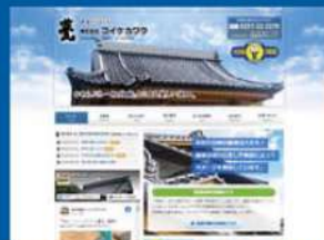
株式会社コイケカワラ様 https://www.irakanonami.com/