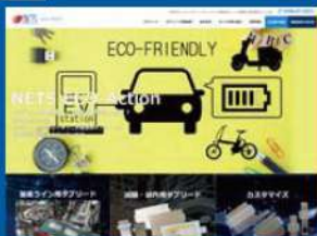
株式会社ネット様 https://www.n-nets.co.jp/