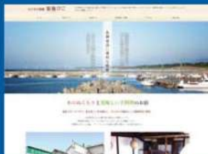
ビジネス旅館 聖籠ぴこ様 https://www.seiro-piko.jp/