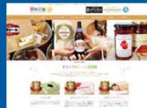
株式会社林屋紙器様 https://www.hayashiya-siki.co.jp/