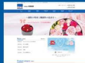
有限会社野村企画様 https://www.nomurakiku.com/