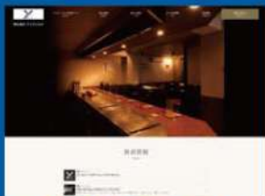
株式会社ワイズビルド様 https://www.ysbld.co.jp/