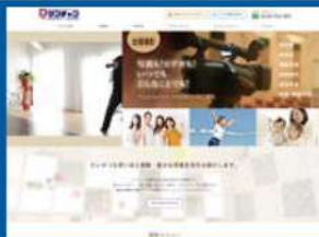
有限会社サンチャンカメラ(高橋写真館)様 https://www.sanchan.jp/