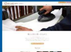
有限会社マミードライ様 https://www.mammydry.jp/