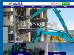
株式会社雄達 様 https://www.niigata-yuuken.co.jp/