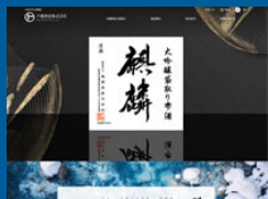
下越酒造株式会社 様 https://www.sake-kirin.com/