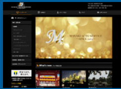
株式会社マサキオートサービス 様 https://www.masaki-auto.co.jp/