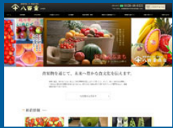
株式会社八百重商店 様 https://www.yajou.jp/