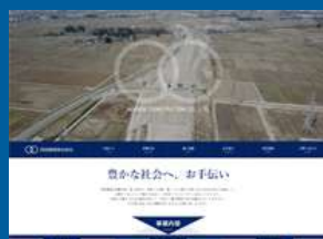
西田建設株式会社様