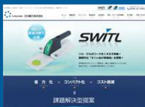
古川機工株式会社様