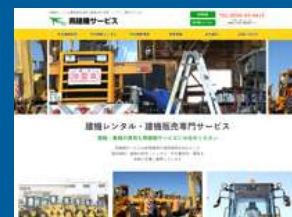
有限会社燕建機サービス様