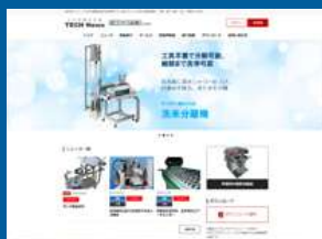
株式会社サンニード様