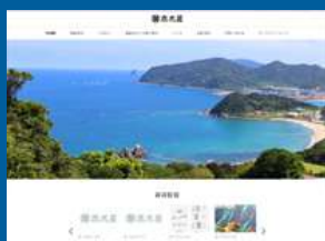
株式会社高木屋様