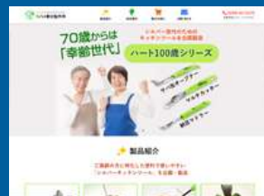
株式会社ツバメ教材様