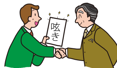
長岡商事 主任 信濃一郎